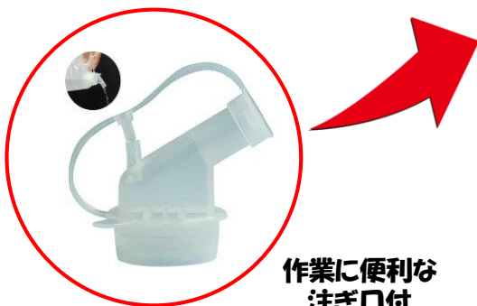
作業に便利な注ぎ口付